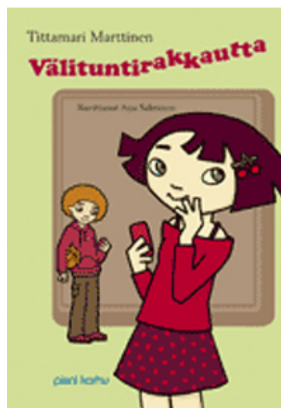
Kuva 8. Vasemmalla aikuisten selkokirja, oikealla lasten selkokirja