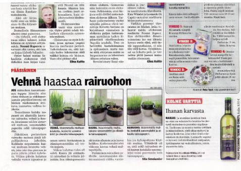
Kuva 4. Vasemmalla ilmapuutettuna taitettu Selkoutusten sivu, oikealla Varti-lehden monenlaista informaatiota sisältävä tiiviisti taitettu sivu.